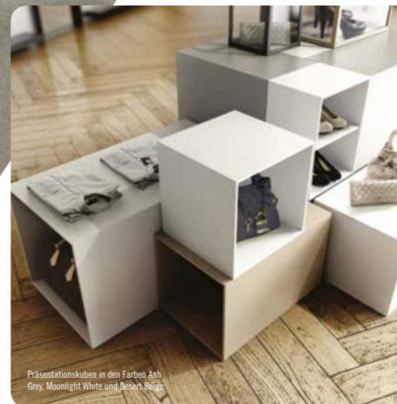
Präsentationskuben in den Farben Ash Grey, Moonlight White und Desert Beige